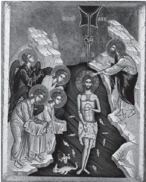
Die christliche Tauftradition wird auf die Taufe Jesu Christi durch Johannes den Täufer zurückgeführt. – Die orthodoxe Tradition hat diesen Moment in einer Ikone festgehalten. Christus taucht ein in den Fluss Jordan; das Wasser symbolisiert zugleich die Welt und das Böse (darum der Drache zu Füßen von Christus). In der Taufe ist damit angedeutet, dass Christus die Welt und das Böse überwinden wird. Das Wasser und damit die ganze Welt wird durch ihn geheiligt. [F. Gietenbruch]

Jede Taufe soll für uns Getaufte auch Gelegenheit zur Tauferinnerung sein: sich selbst immer wieder bewusst zu machen, dass man getauft ist