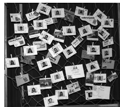
Die Kirchgemeinde als Netz: Veranstaltungen und Menschen unserer Kirchgemeinde sind alle Teil eines grossen Netzes, das trägt: getragen von Gott und uns untereinander. Dieses Netz möchten wir uns bewusst machen.

Der Anlass findet bei jedem Wetter statt. Wir freuen uns auf Ihren Besuch!