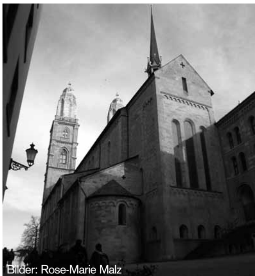
Das Zürcher Grossmünster und das Basler Münster aus ungewohnter Perspektive.